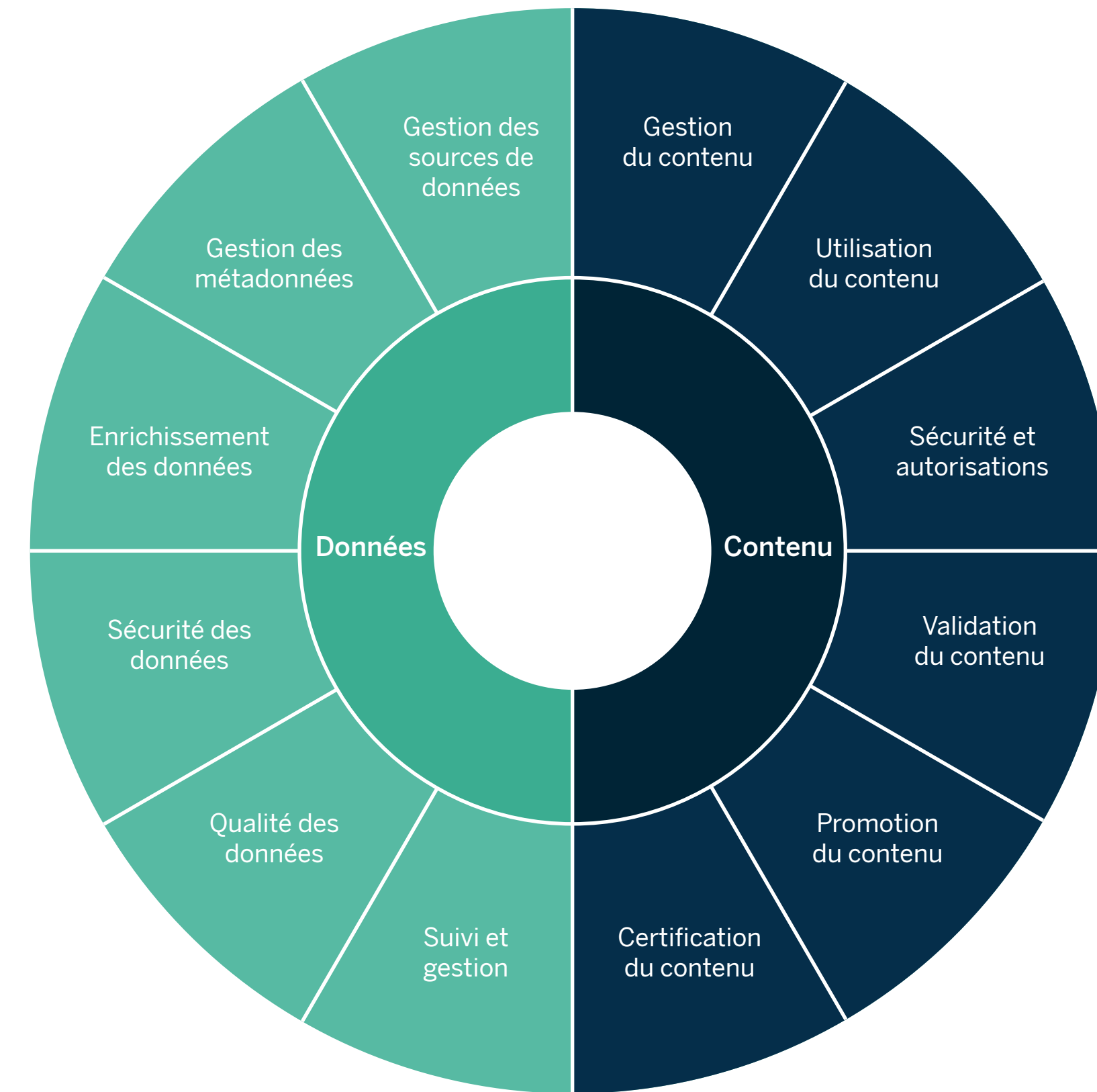
Tableau propose une structure de gouvernance pour les données et le contenu.

Il est essentiel de garder à l'esprit que chaque type de données nécessite un niveau de gouvernance différent. Et surtout, l'analytique en libre-service et évolutive doit être envisagée comme un processus continu et itératif, plutôt qu'un objectif. Votre modèle de gouvernance sera efficace si vous êtes en mesure de l'adapter pour répondre aux nouveaux besoins, en vous assurant que vos utilisateurs restent informés et autonomes, et qu'ils se conforment à vos politiques.